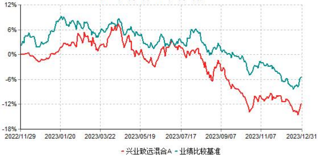
兴业致远混合A累计净值增长率与业绩比较基准收益率历史走势对比图 (2022年11月29日-2023年12月31日)

注：本基金基金合同于2022年11月29日生效，根据本基金基金合同规定，本基金自基金合同生效之日起六个月内已使基金的投资组合比例符合基金合同的约定。