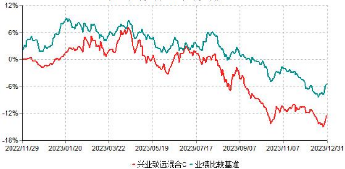
兴业致远混合C累计净值增长率与业绩比较基准收益率历史走势对比图 (2022年11月29日-2023年12月31日)

注：本基金基金合同于2022年11月29日生效，根据本基金基金合同规定，本基金自基金合同生效之日起六个月内已使基金的投资组合比例符合基金合同的约定。