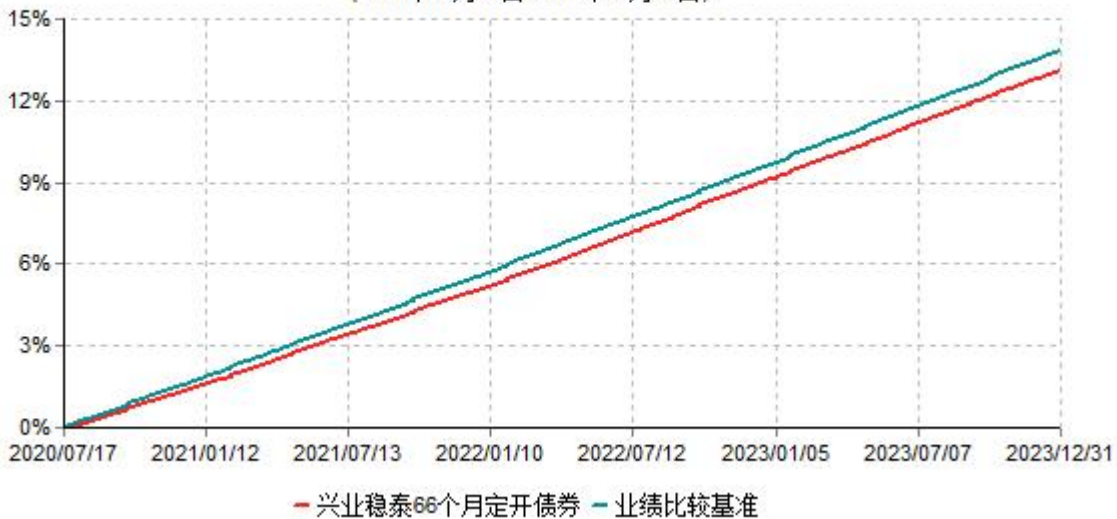
兴业稳泰66个月定期开放债券型证券投资基金累计净值增长率与业绩比较基准收益率历史走势图对比图 (2020年07月17日-2023年12月31日)