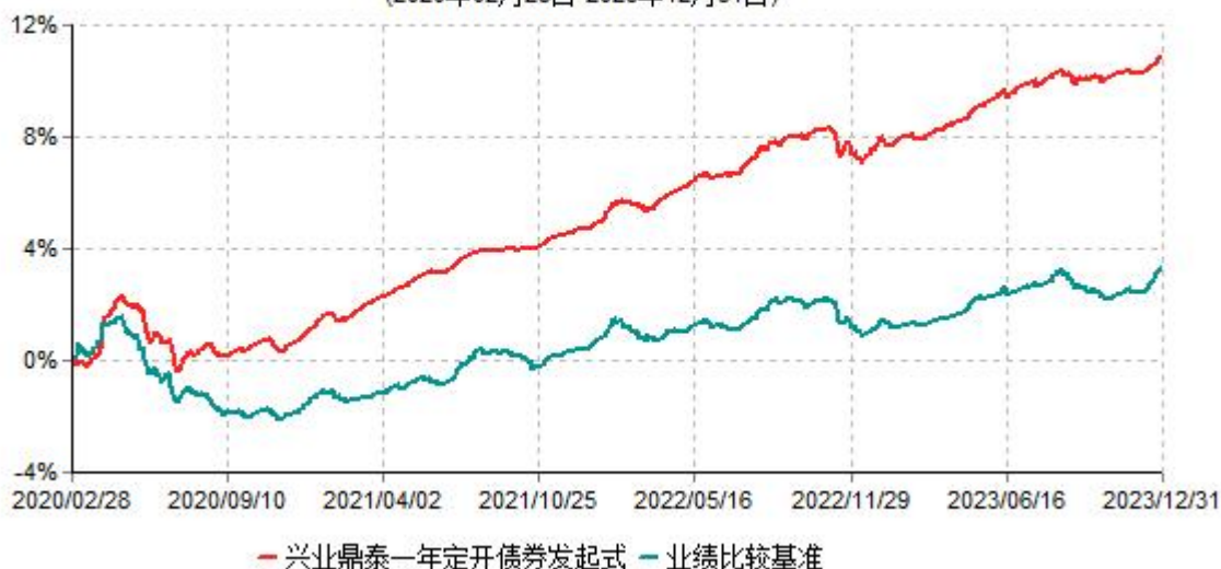
兴业鼎泰一年定期开放债券型发起式证券投资基金累计净值增长率与业绩比较基准收益率历史走势对比图 (2020年02月28日-2023年12月31日)