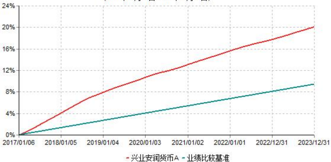
兴业安润货币A累计净值收益率与业绩比较基准收益率历史走势对比图 (2017年01月06日-2023年12月31日)