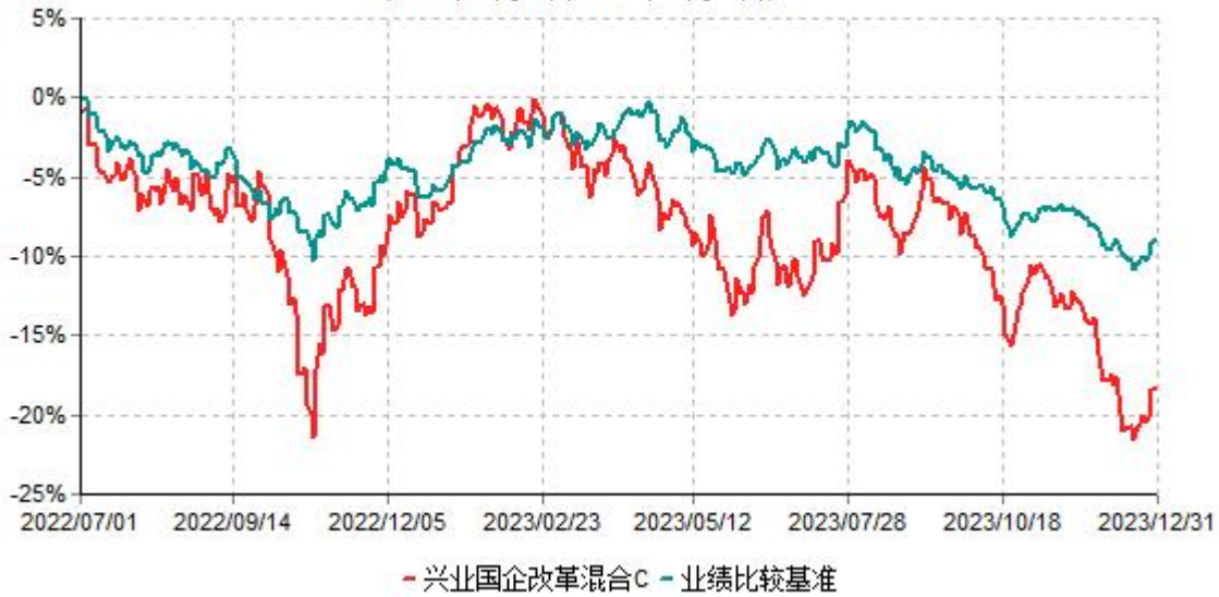
兴业国企改革混合C累计净值增长率与业绩比较基准收益率历史走势对比图 (2022年07月01日-2023年12月31日)

注：1、本基金基金合同于2015年9月17日生效，根据本基金基金合同规定，本基金自基金合同生效之日起六个月内已使基金的投资组合比例符合基金合同的约定。 2、本基金自2022年06月17日起增设C类份额，自2022年07月01日起C类份额存续，上述业绩表现按实际存续期计算。