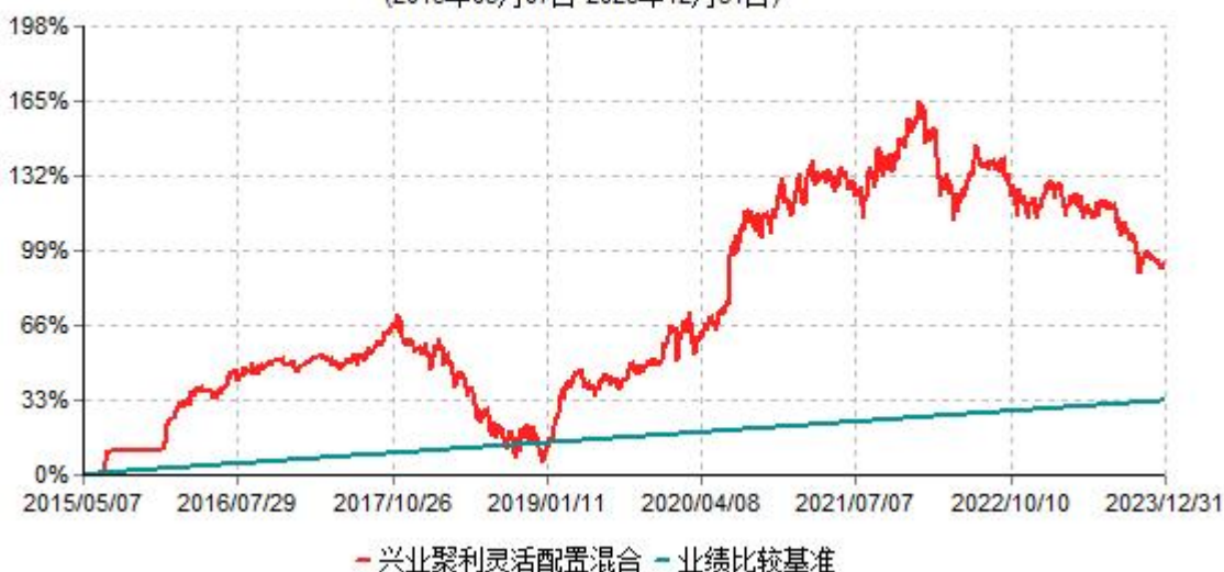
兴业聚利灵活配置混合型证券投资基金累计净值增长率与业绩比较基准收益率历史走势对比图 (2015年05月07日-2023年12月31日)

注：本基金基金合同于2015年5月7日生效，根据本基金基金合同规定，本基金自基金合同生效之日起六个月内已使基金的投资组合比例符合基金合同的约定。