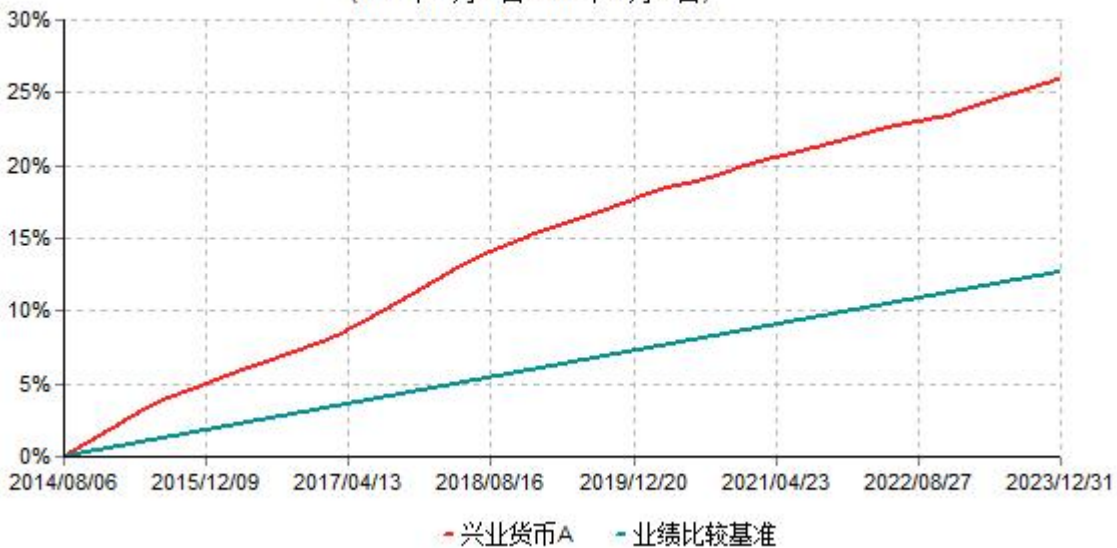
兴业货币A累计净值收益率与业绩比较基准收益率历史走势对比图 (2014年08月06日-2023年12月31日)