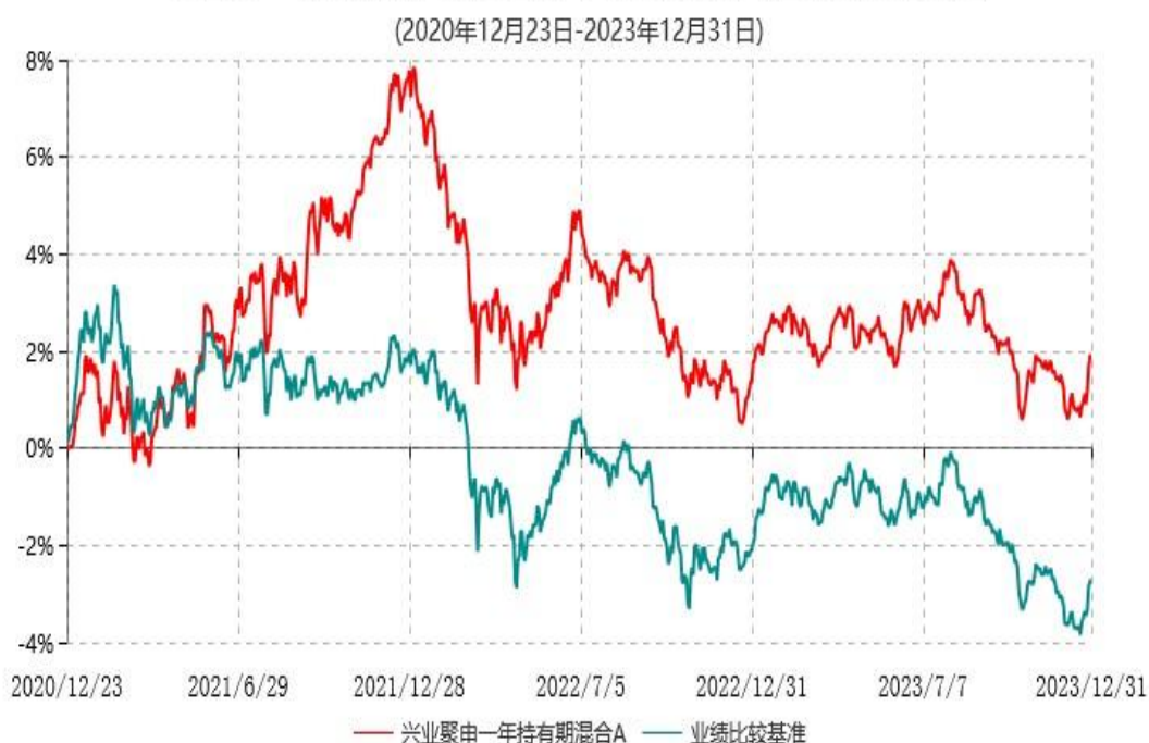
兴业聚申一年持有期混合A累计净值增长率与业绩比较基准收益率历史走势对比图

注：本基金基金合同于 2020 年 12 月 23 日生效，根据本基金基金合同规定，基金管理人自基金合同生效之日起 6 个月内已使基金的投资组合比例符合基金合同的有关约定。