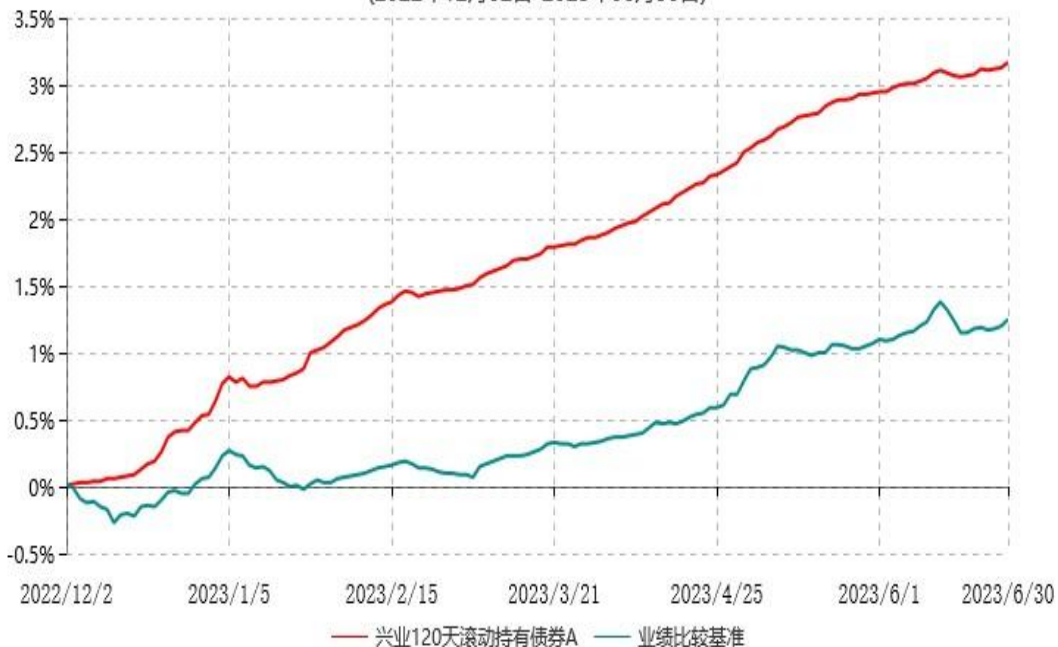
兴业120天滚动持有债券A累计净值增长率与业绩比较基准收益率历史走势对比图 (2022年12月02日-2023年06月30日)