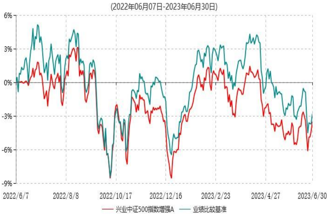
兴业中证500指数增强A累计净值增长率与业绩比较基准收益率历史走势对比图

注：本基金基金合同于2022年06月07日生效，本基金自基金合同生效之日起六个月内已使基金的投资组合比例符合基金合同的约定。