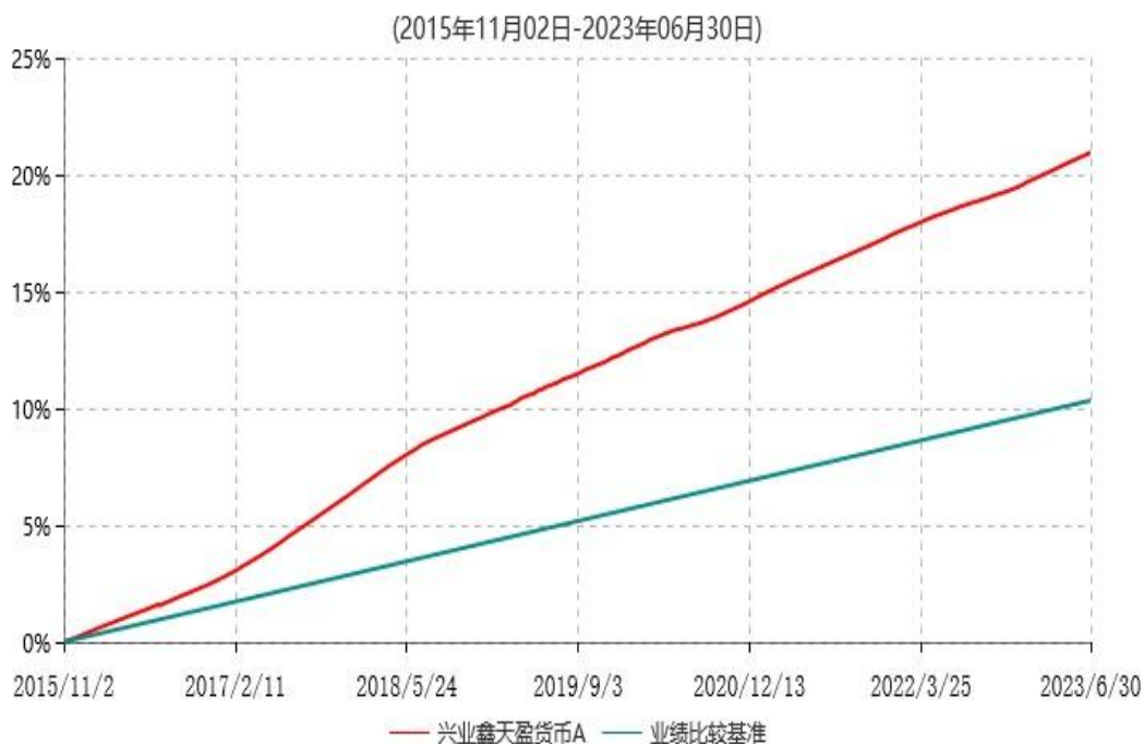
兴业鑫天盈货币A累计净值收益率与业绩比较基准收益率历史走势对比图